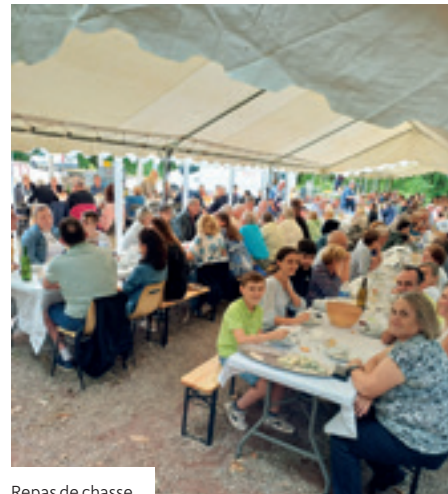
Repas de chasse

2026 A vos agendas ! (Inscriptions auprès des animateurs de la société.)