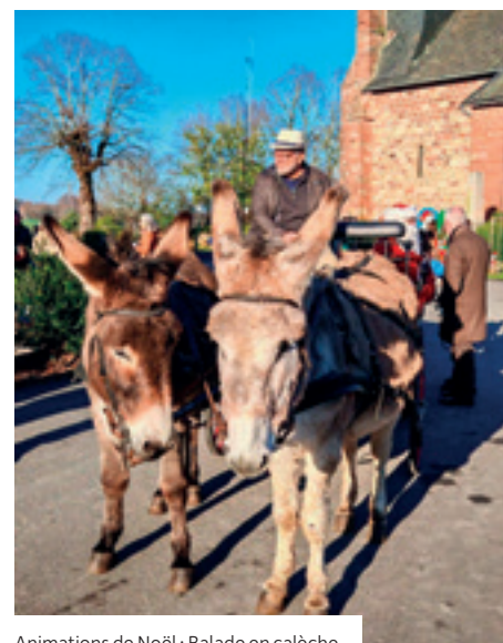
Animations de Noël : Balade en calèche

De belles valeurs partagées, de beaux souvenirs à raconter... ainsi s'est refermée cette belle parenthèse cosnacaise enchantée.