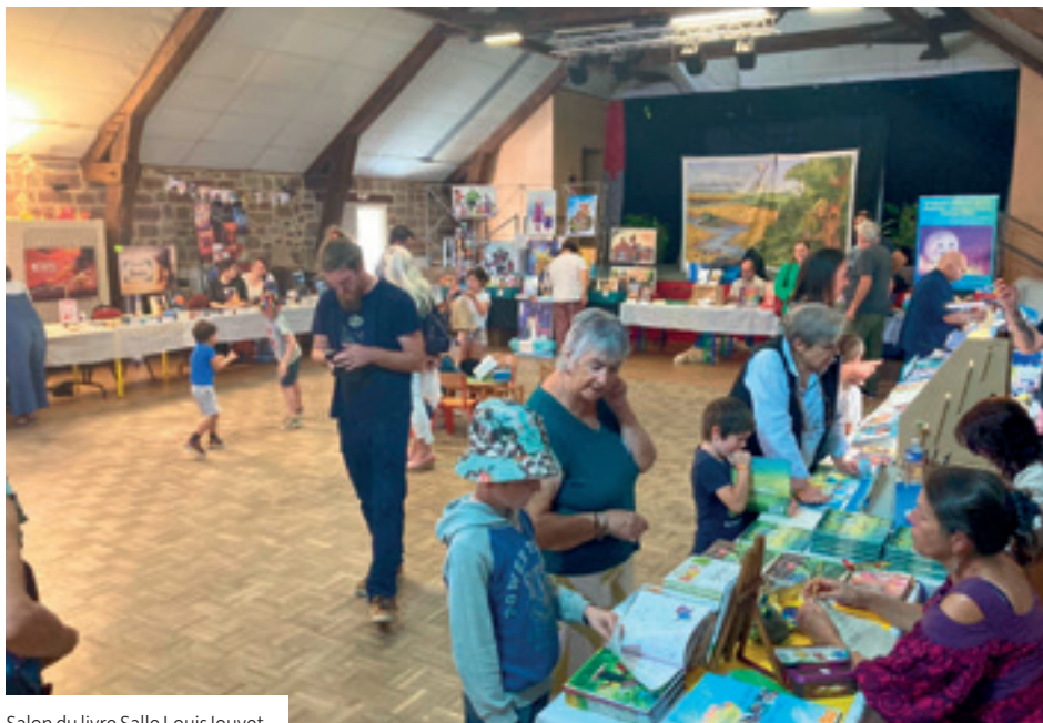
Salon du livre Salle Louis Jouvet

l'extérieur, le groupe d'adolescents de l'Espace Teyssandier avait imaginé des jeux tels que le renard taquin ou mon petit mouton, très appréciés des plus jeunes, et tenait également un stand buvette et pâtisserie. Ce rendez-vous culturel, rendu possible par l'investissement des nombreux bénévoles, confirme son importance croissante dans la vie communale.