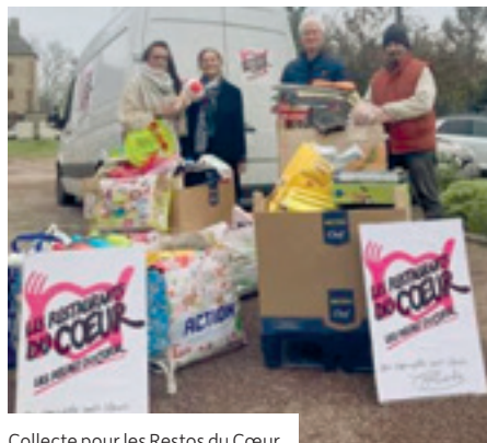
Collecte pour les Restos du Cœur

Dans le cadre du « vide ta chambre », l'Espace municipal de Vie Sociale a organisé une collecte à destination des restos du cœur.