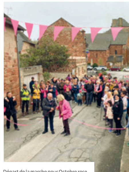
Départ de la marche pour Octobre rose

Dès les premières heures, les nombreux bénévoles mobilisés ont accueilli chaleureusement