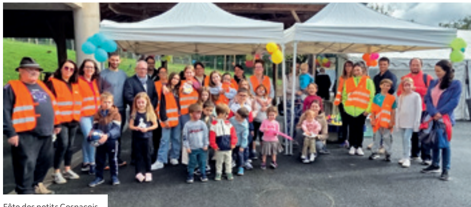
Fête des petits Cosnacois

Merci pour votre soutien et votre participation aux différents événements. Ensemble, faisons vivre nos écoles et nos enfants !