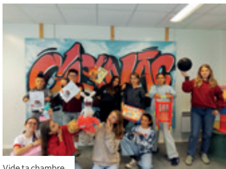
Vide ta chambre

En novembre, avant l'arrivée du Père Noël, ils ont proposé l'incontournable « Vide ta Chambre ». Cette journée a été l'occasion