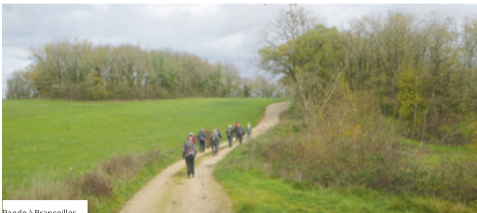
Rando à Branceilles

L'association Rando Réveil , affiliée à la FFRandonnée, poursuit son chemin entre Corrèze, Lot ou Dordogne pour des randos à la journée entre 15 et 20 kms, le pique-nique est tiré du sac. De beaux parcours en toute convivialité et sans compétition.