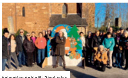
Animation de Noël : Bénévoles

Samedi 14 décembre, sous un beau soleil automnal, tout était prêt pour accueillir le public venu nombreux : chapiteaux dressés, bourg décoré, salle polyvalente transformée en maison et ateliers du père Noël.